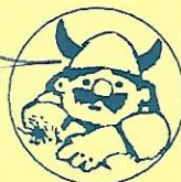
Vorsitzender der Deutschen Finanzsporthilfe