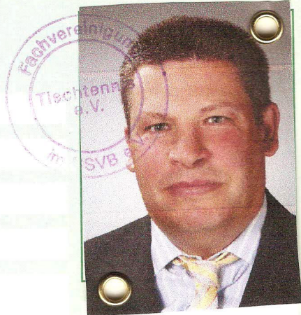
Raum für FVTT Vermerke